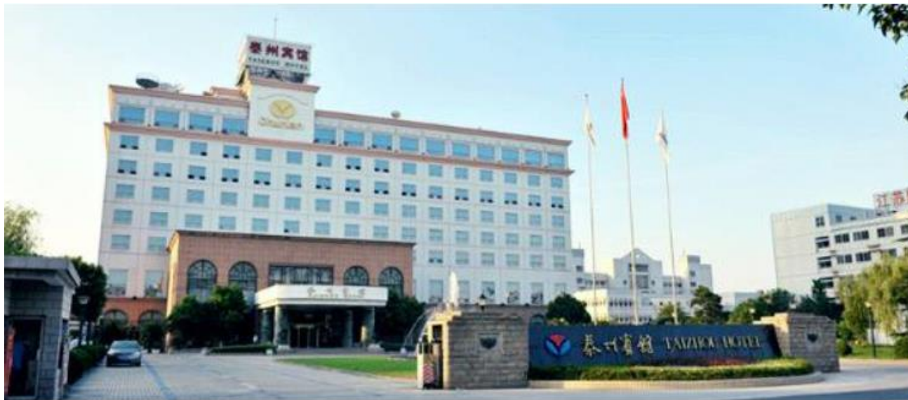
Le Championnat du Monde féminin aura lieu à l'hôtel Chunlan