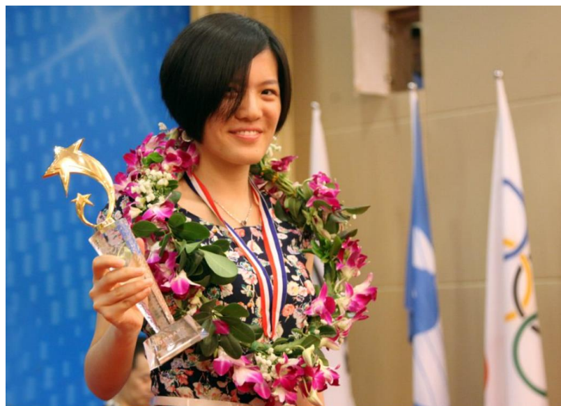
Hou Yifan, vainqueur