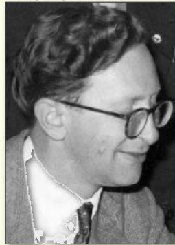
Vassily Smyslov in 1958

Smyslov a les Blancs dans les parties impaires