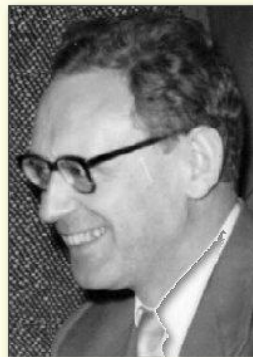
Mikhaïl Botvinnik in 1958