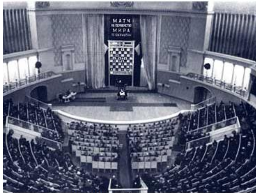
Tchaikovsky Concert Hall, Moscow 1951

Botvinnik a les Blancs dans les parties impaires