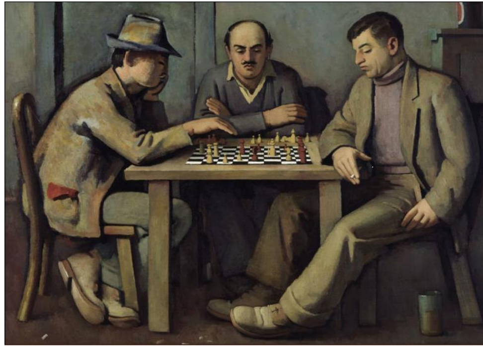
COOK - "The chess players"