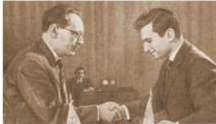
Tal and Botvinnik, 1961

Botvinnik a les Blancs dans les parties impaires