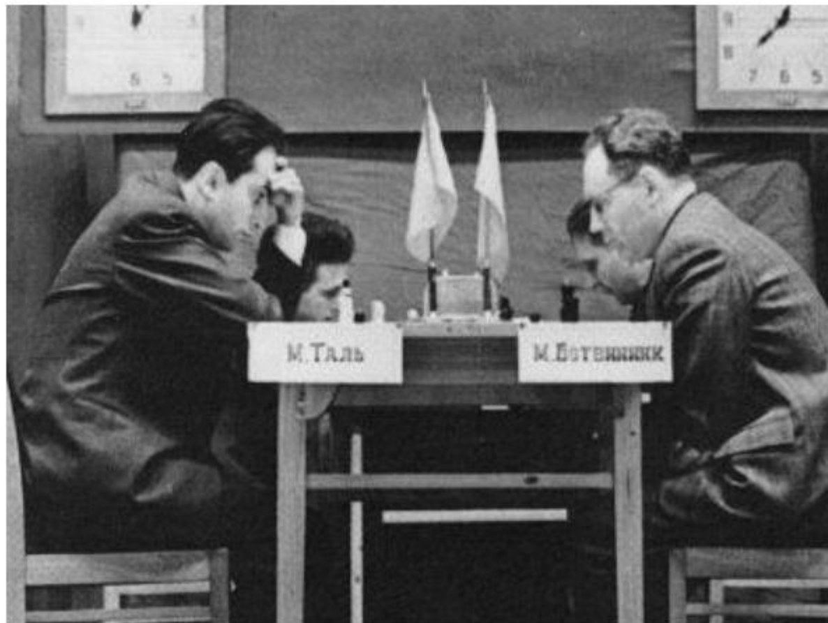
Tal and Botvinnik, 1960