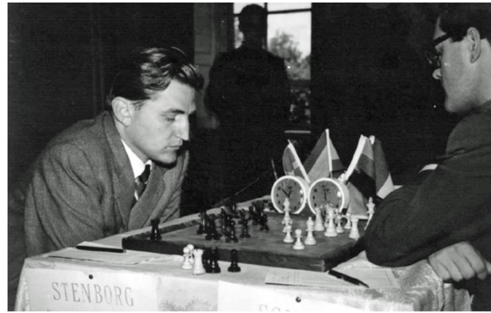
IM Ake Stenborg, SWE, left and IM Lothar Schmid, FRG www.echecstoujoursplus.fr - mai 2026