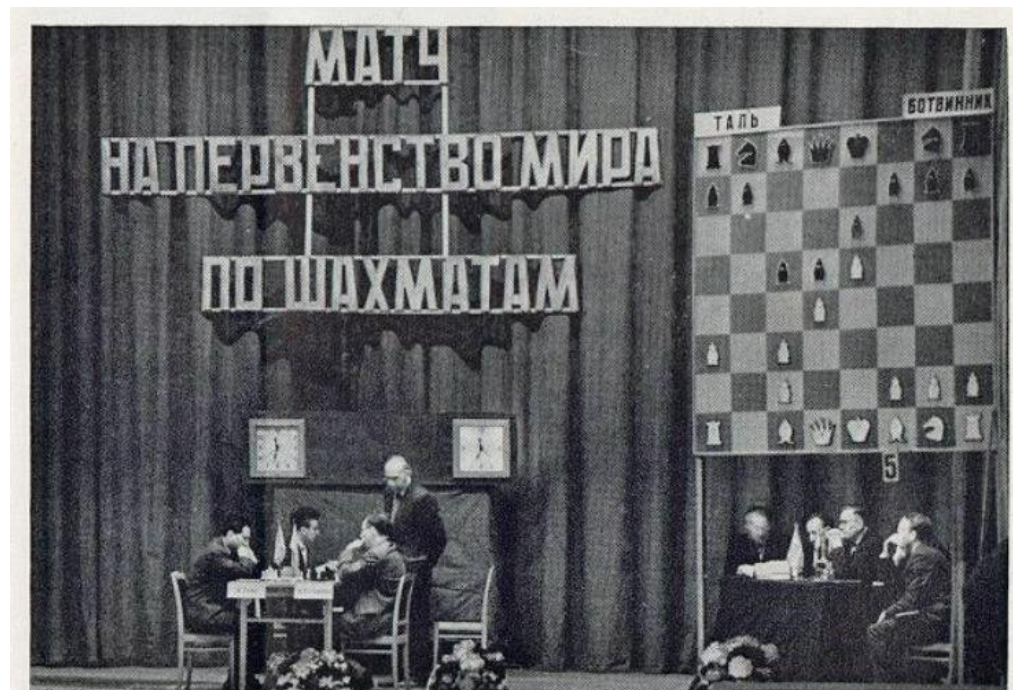
The first game of the match with World Champion Botvinnik behind the Black men. British master Harry Golombek, standing, is Assistant Umpire. Former World Champion Max Euwe, at table with hands clasped, represents the FIDE for the opening of the match.

Tal a les Blancs dans les parties impaires