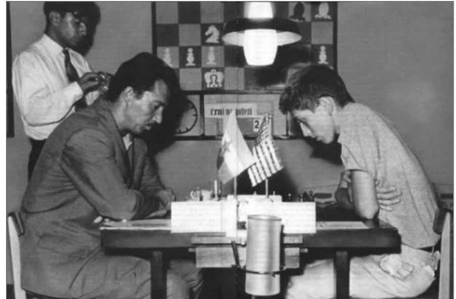
Gligoric - Fischer