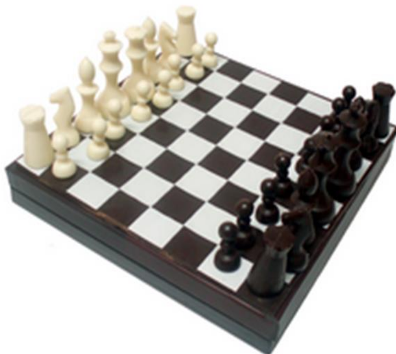
"L'échiquier Grand-Maître" - Albert Chocolatier (Les Herbiers - 85)