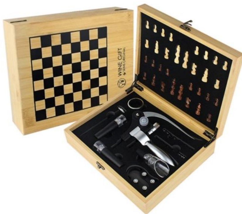
Nature et Découvertes