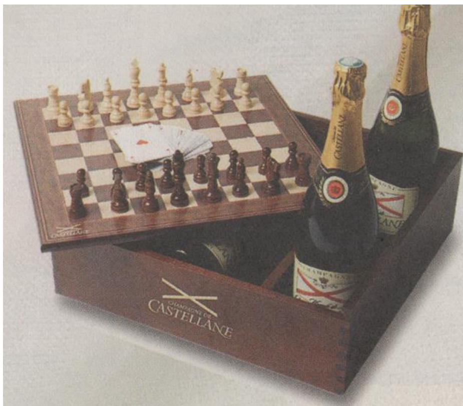
De Castellane - Coffret échiquier