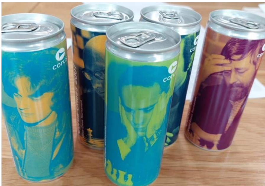
Tournoi CORUS - Wijk-aan-Zee (Pays-Bas)