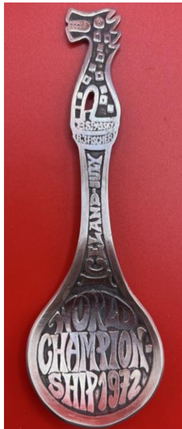
Championnat du Monde Fischer-Spassky, 1972, Reykjavik