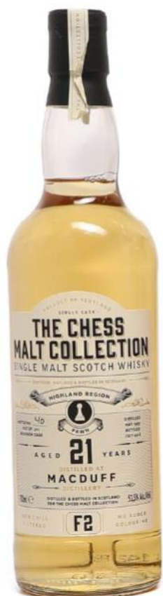
Single Malt Scotch Whisky The chess Collection