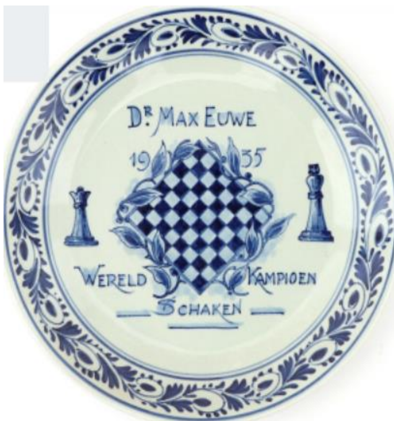
Porceleyne Fles - 1935