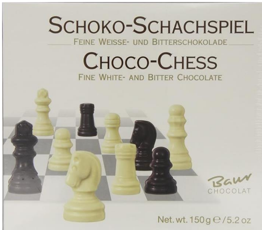
Chocolat Baur (Allemagne)