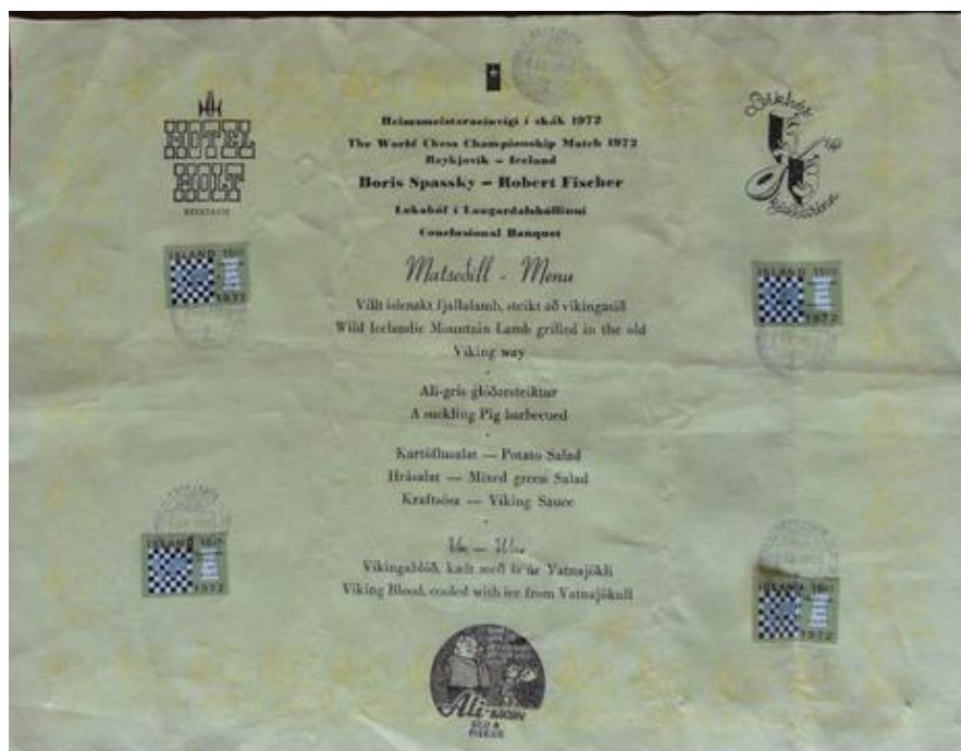
Menu du dîner de gala Fischer-Spassky - 1972