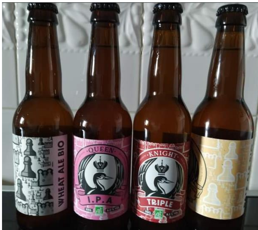
Pièces d'échecs sur l'étiquette - 2024