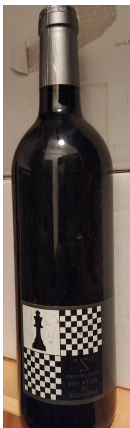
"Z" Degrenardières - Vin de pays de l'Hérault