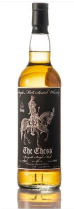
Single malt - 1973