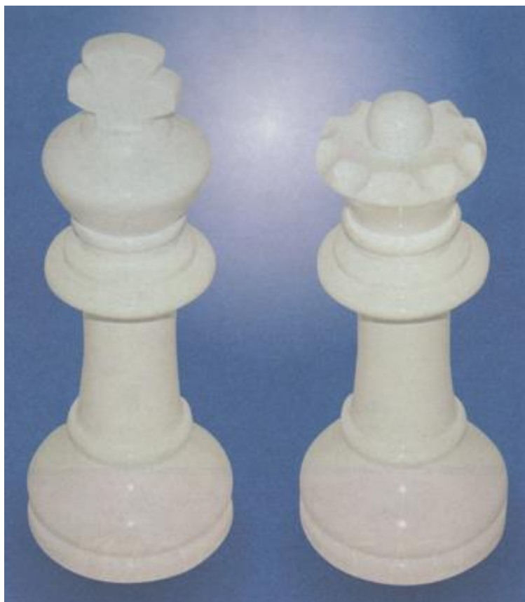
Bathroom Graffiti - Roi ou reine