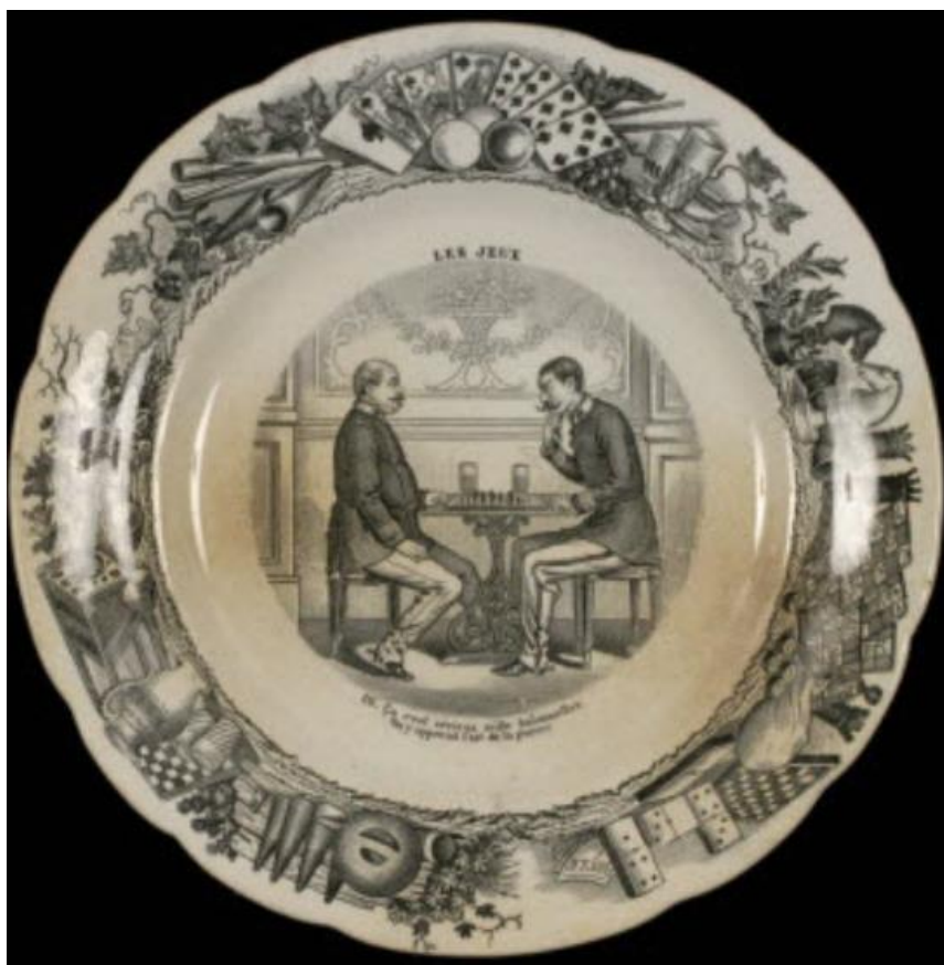
Faïence de Choisy-le-Roi - 1881 (exposée au Mucem)