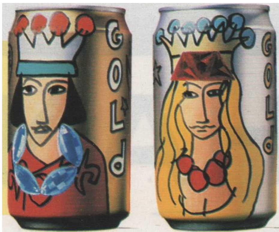
Gold - décor de J-C de Castelbajac