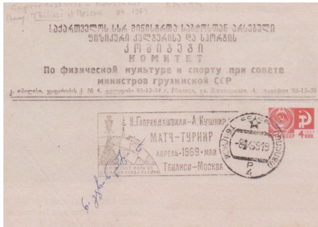
(avec signature de Gaprindashvili)

Kushnir a les Blancs dans les parties impaires