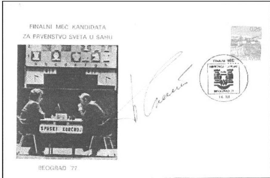
(avec signature de B. Spassky)